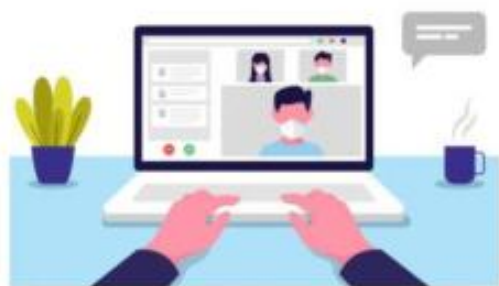
图 1 第一机位示意图

①一对一面试系统测试: 面试采用线上面试, 一机位(电脑端)为腾讯会议, 正面对考生, 二机位(手机端)为钉钉(视频会议), 置于斜后方45度。 电脑及手机端均需开启摄像头, 声音只要电脑端开启, 不得佩戴耳机等, 考生座位1.5米范围内不得存放任何书刊、报纸、资料、电子设备等。同时请考生提前准备空白ppt, 掌握屏幕共享等相关使用方法。