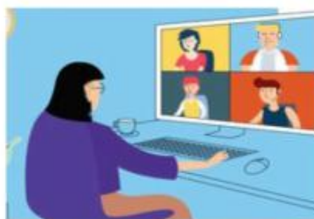
图 2 第二机位拍摄效果示意图